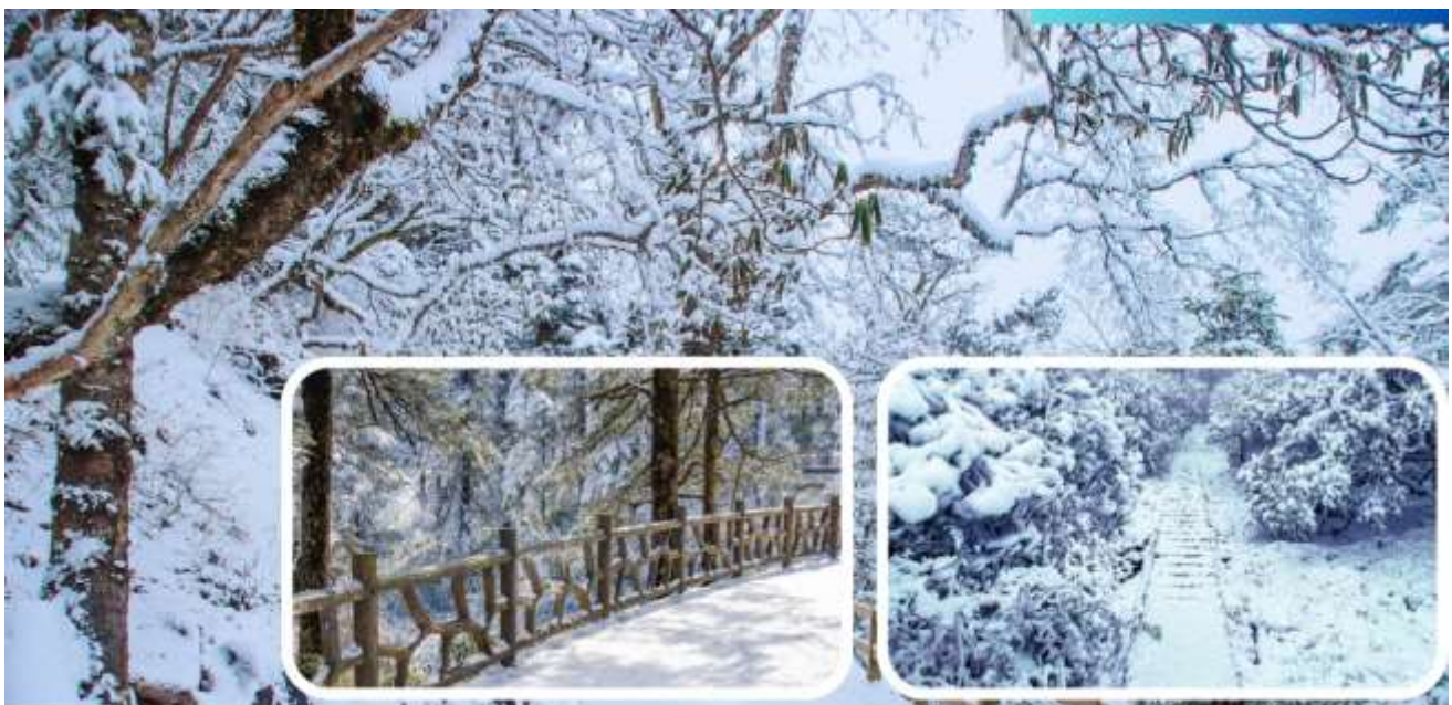
Wawu Mountain (WINTER)

จากนั้นนำท่านเดินทางสู่เมืองเหมยซาน ภูเขาหิมะวาวู (เวลาเดินทางประมาณ 3 ชั่วโมง) ภูเขาหิมะวาวู ตั้งอยู่ใน อำเภอหงยา (Hongya County) เมืองเหมยซาน มณฑลเสฉวน ประเทศจีน พื้นที่อุทยานป่าเป็นเขตอุทยานแห่งชาติป่า (National Forest Park) “วาวู” (Wawu / Wawushan) มีชื่อเสียงว่าเป็นภูเขาโต๊ะ (table mountain) — ยอดแบนคล้ายโต๊ะ ซึ่งเป็นลักษณะที่โดดเด่นของภูเขานี้ เป็นที่ท่องเที่ยวที่นักท่องเที่ยวนิยมมาชมหิมะเริ่มตกตั้งแต่ประมาณ เดือนพฤศจิกายน จนถึง เดือนพฤษภาคม ของปีถัดไป