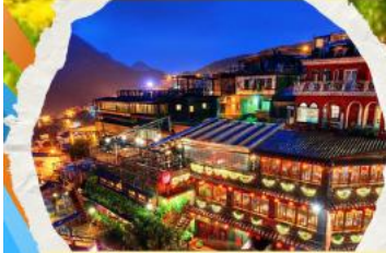
หมู่บ้านโบราณฉิวเฟิ่น