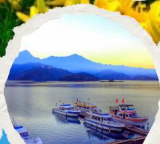
ทะเลสาบสุริยขึ้นจินทารา