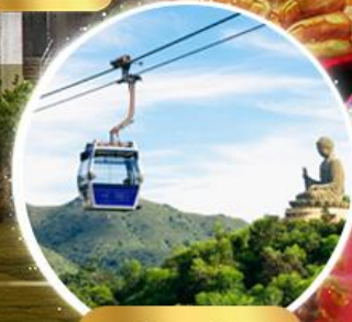
กระเช้าองปิง 360