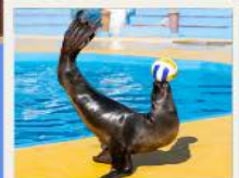
POLAR OCEAN PARK