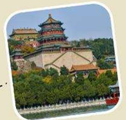
4 พระราชวังฤดูร้อน