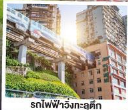
รถไฟฟ้าวิ่งทะลุคิก