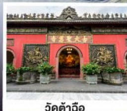
วัดตำฉือ