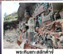
พระหินแกะสลักตำจู้