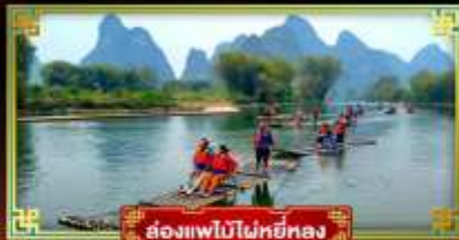
ล่องแพไม้ไผ่หยี่หลง