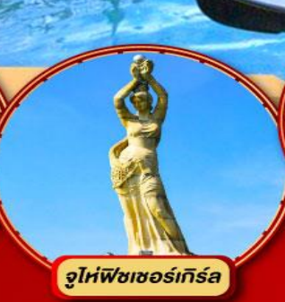
จูโห้ฟิชเซอร์เก็ร