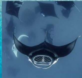
Manta Ray Snorkeling